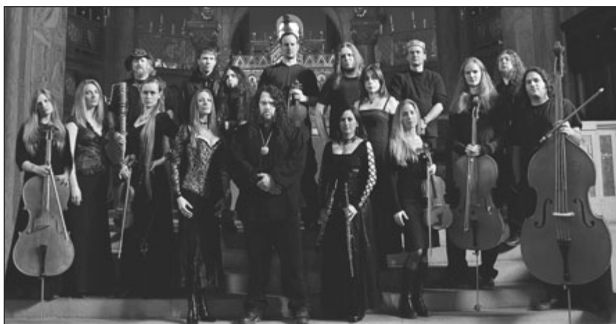
Německá skupina Haggard představí unikátní spojení metalové a vážné hudby v klasickém nástrojovém obsazení

Tím však výčet mistrů tohoto žánru rozhodně nekončí. Velkému zájmu fanoušků